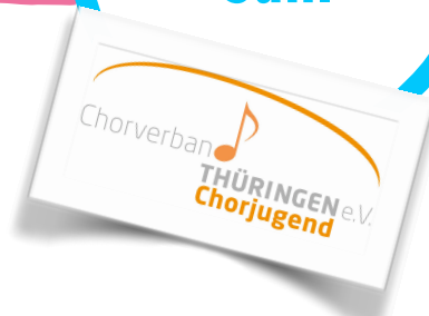
Bild- und Tonaufnahmen

Es summt und brummt in Wies und Feld (Sommer)