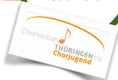
Bild- und Tonaufnahmen

Wir informieren darüber, dass der Chorverband Thüringen e.V. die während des Workshops entstandenes Bild- und Tonmaterial für Berichterstattungen und Werbemaßnahmen in den Printmedien (Plakate und Flyer, Verbandszeitschrift, Pressemitteilungen, Zeitungsinserate etc.) sowie den digitalen Medien und sozialen Netzwerken (Homepage, Facebook, Instagram, YouTube) nutzt.